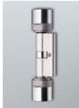
Digitaler Europrofil Doppelknaufzylinder

Der digitale Schließzylinder 3061 setzt in der DoorMonitoring-Ausführung neue Maßstäbe im Bereich der Objektsicherheit. Über seine Schließ- und Zutrittskontrollfunktion hinaus bietet er eine kompakte Türüberwachung. Ein Sensor in der Stulpschraube überwacht den Zustand und die Zustandsänderungen der Tür – diese Informationen werden aktiv über das WaveNet an die LSM Locking System Management Systemsoftware weitergeleitet und dort verarbeitet.