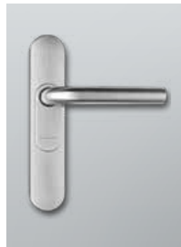
Digitaler Türbeschlag SmartHandle 3062 für Türen im Außenbereich

Der neue Innentür-Beschlag SmartHandle AX steht für die sprichwörtliche Intelligenz im Griff. Kompakte Bauweise, modularer Aufbau, attraktives Design und leistungsfähige Elektronik sorgen für höchsten Nutzerkomfort.