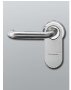
Digitaler Türbeschlag SmartHandle AX für Türen im Innenbereich