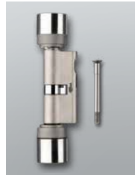
Digitaler Europrofil Doppelknaufzylinder mit DoorMonitoring