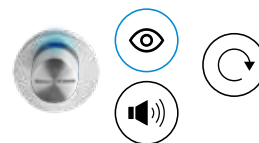
2) Cylindre numérique AX