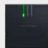
Lecteur à LED SmartRelais 3 Advanced