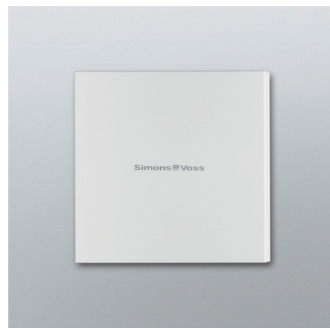
(Unità di lettura esterna)