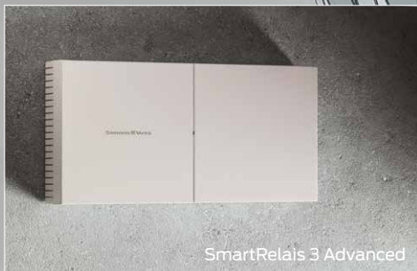
SmartRelais 3 Advanced