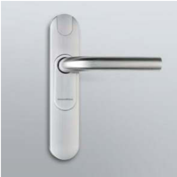
Abbildung 2 – Smart Handle 3062 Mifare Pure

Wesentliche Neuerung jedoch ist die Unterstützung des neuen SmartHandle MP, die eine Vervollständigung des SimonsVoss Portfolios für Kartenprodukte darstellen.