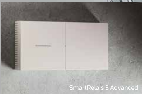
SmartRelais 3 Advanced