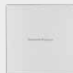
SmartRelais 2 Leser