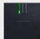
SmartRelais 3 Advanced / SmartRelais AX Classic LED Leser